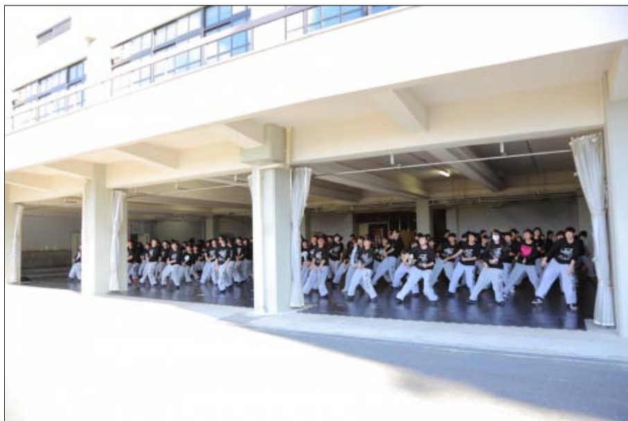
大人数で練習に励む部員たち