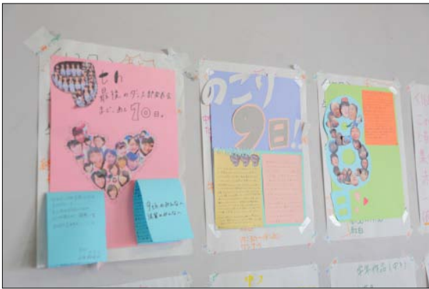
掲示物で全員が共有の課題として意識

しかし、同志社香里高校のダンス部は理想的とも言える「自分たちで考え、実行し、 結果を出す」ということに成功しました。恐らく彼女たちは部活動を通じて、他の高校 生たちよりも、より高いレベルで自主性、協調性、責任感、連帯感、そしてコミュニケ ーション能力を伸ばすことが出来ているのではないのでしょうか。