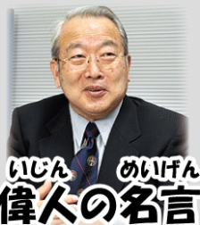
いじん めいげん 偉人の名言

い はや ていねい だいいち きも いま いつも言っているように「速さよりも丁寧さを第一に」の気持ちで、今 いじょう しんけん と く くだ まで以上に真剣に取り組むようにして下さいね。