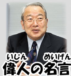
いじん めいげん 偉人の名言

い はや ていねい だいいち きも いま いつも言っているように「速さよりも丁寧さを第一に」の気持ちで、今 いじょう しんけん と く くだ まで以上に真剣に取り組むようにして下さいね。