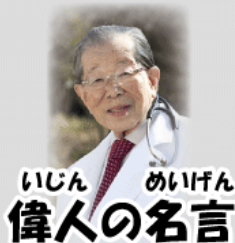
いじん めいげん 偉人の名言