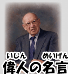
いじん めいげん 偉人の名言

さまざま めん ふ おも そうすれば様々な面でうまくいくことが増えると思いますよ！